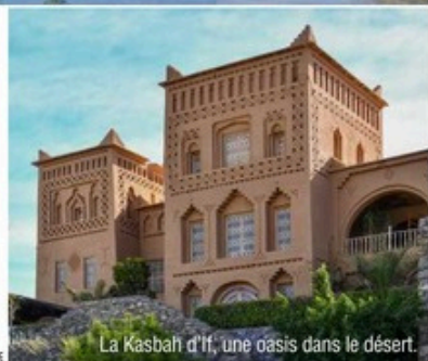
La Kasbah d'If, une oasis dans le désert.

Entre le désert d'Agafay et l'Atlas, la Kasbah d'If a des airs de refuge. Ici, tout commence par la matière : pierre, terre, bois, travaillés par des artisans venus de tout le Maroc, dont les gestes perpétuent un héritage ancestral. L'hôtel majestueux (5 étoiles) apparaît comme un mirage. Trente-sept suites spacieuses permettent un vrai dépaysement. Partout, l'âme du voyageur berbère est présente. Creusé dans la roche, le spa invite à la déconnexion totale. Côté restauration, cinq lieux avec une cuisine marocaine revisitée sont ouverts en alternance en fonction des saisons. Excursions avec adrénaline ou pratique du yoga face au désert : tout le monde trouve ce qui rendra son séjour encore plus mémorable. Le clou du spectacle ? L'immense piscine avec une vue à 360 degrés. Magique ! ■