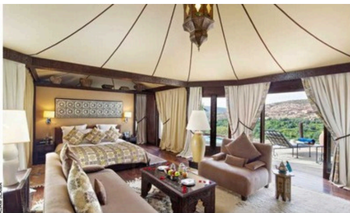
La Kasbah Tamadot, un lieu enchanteur niché au pied du Haut Atlas.